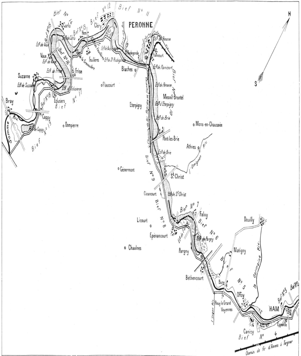
PLANCHE II. — Larve des étangs de la Haute-Somme.